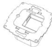
Compatibele voedingsadapter 12W optioneel